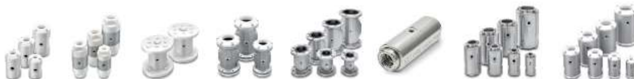
FOT. 1, 2, 3, 5, 5, 6, 7, 8 Od lewej zawory zaciskowe serii: 00, 10, 21, 40, 41, 60, 70, 80

Żeby szczelnie zamknąć zawór, należy doprowadzić sprężone powietrze o ciśnieniu o 2,0–2,5 bar większym niż ciśnienie w rurociągu. Jeżeli zastosujemy wyższe ciśnienie, może wpłynąć to na szybsze zużycie wkładu. Zawory można stosować do maksymalnego ciśnienia w rurociągu wynoszącego 4 bar.